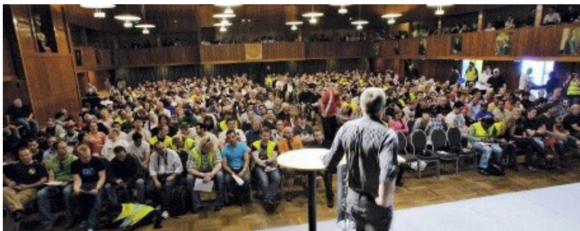
Streikemøte i Samfunnshuset under vekterstreiken i 2010.