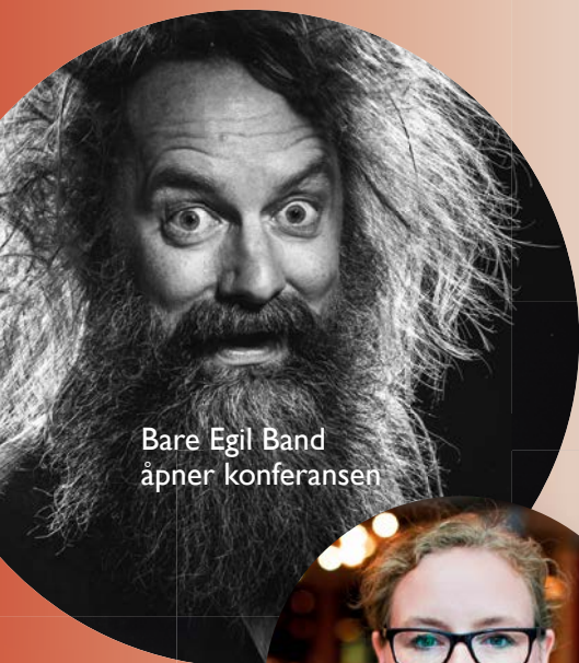
Bare Egil Band åpner konferansen